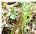
ショウジョウバエモドキ