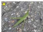
ショウジョウバエ