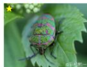
アカスジケンカメムシ