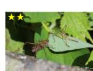
キリギリス科 (ニシキリギリス、 ヒガシキリギリスの2種)