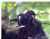
フェモラータ オオモモヅクハムシ