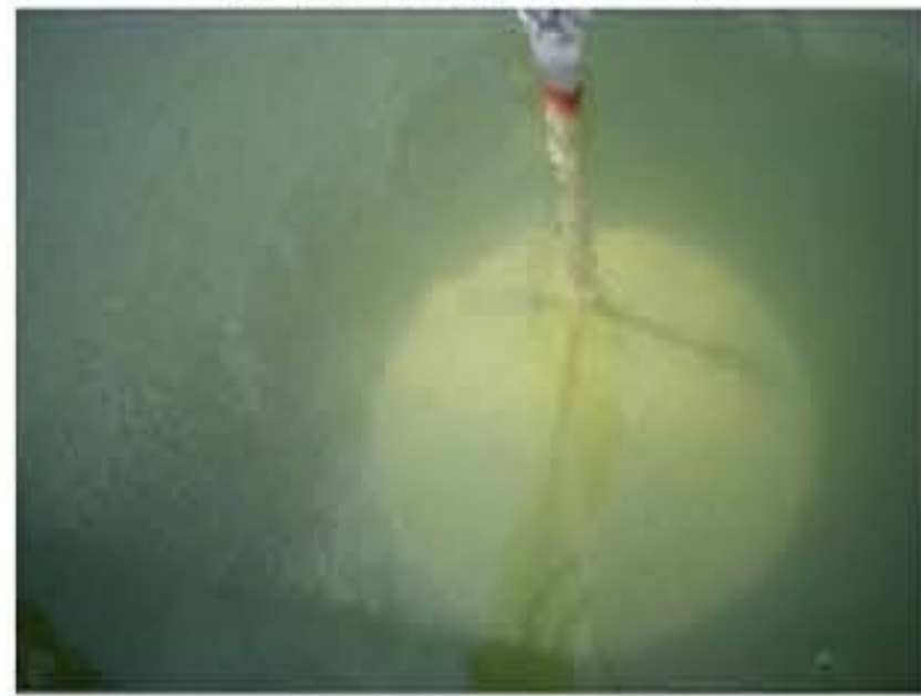
宍道湖サイト(透明度 1.0m)

直径30センチメートルの白色の円板を水中に沈め、肉眼で見える限界の深さを透明度として計測します。伊豆沼サイト（透明度0.7m）では撮影せず。