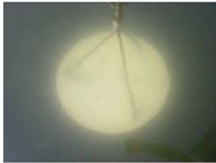
中海サイト(透明度 1.7m)