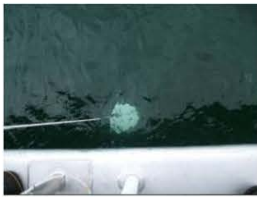
琵琶湖サイト(透明度 5.2m)