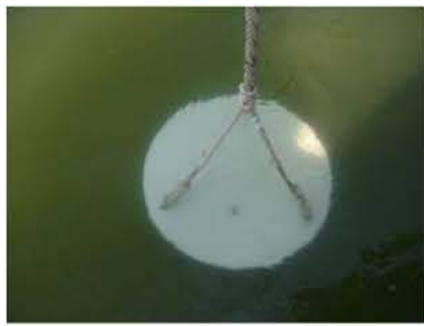
霞ヶ浦サイト(透明度 0.95m)