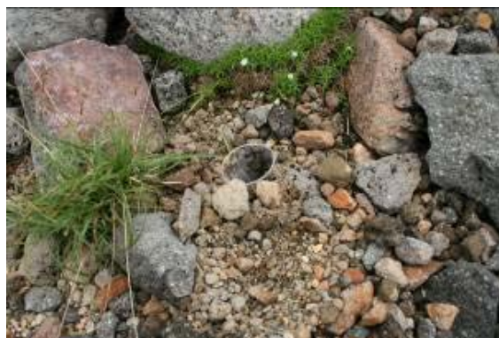
風衝荒原に設置したトラップ

トラップの設置は、南竜ヶ馬場地点で石礫が多く、コップを埋めるのにやや手間取ったものの、それほど難しくはありませんでした。7月の調査は多量のゴミムシ類が採集できましたが、8月調査時は夜半から雨になり、一時激しく降ったこともあって期待通りの成果は得られませんでした。白山高山帯におけるゴミムシ類は、7月上旬から下旬が最も多く(平松、2000)、8月上旬もまだ少なくないと思われるので、この時期に採集できなかったのは、天候の影響によるものと考えられます。一方で、出現種