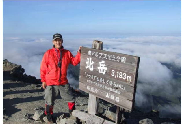
北岳山頂 2009年8月28日 am7:00 チョウの調査には絶好の晴天