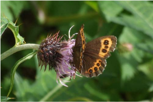
クモベニヒカゲ 2009年8月30日 北岳草スベリ

ている高山帯の生態系は、気候の変動や人間活動の影響を受けやすい脆弱な生態系です。モニタリングサイト 1000 の調査を通して、高山の虫たちをしっかりと見つめていきたいと思ひます。