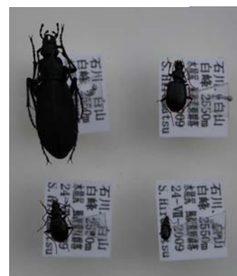
捕獲された地表性甲虫