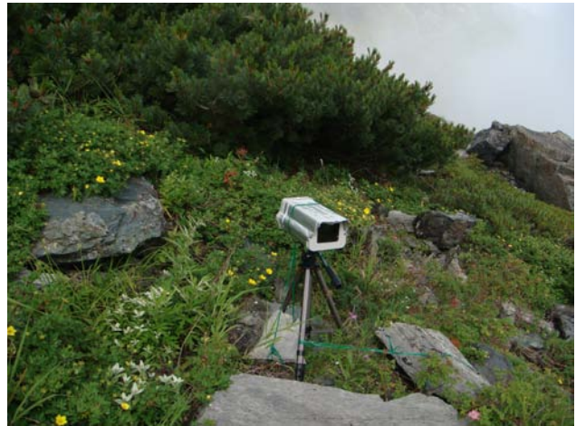
インターバルカメラ