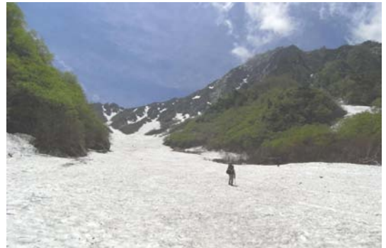
雪渓を登る(北岳 6月) 高山帯の調査はアプローチが大変です

検討会の資料や議事概要などは随時、モニタリングサイト1000Webサイトに掲載されますので、ぜひご覧ください。