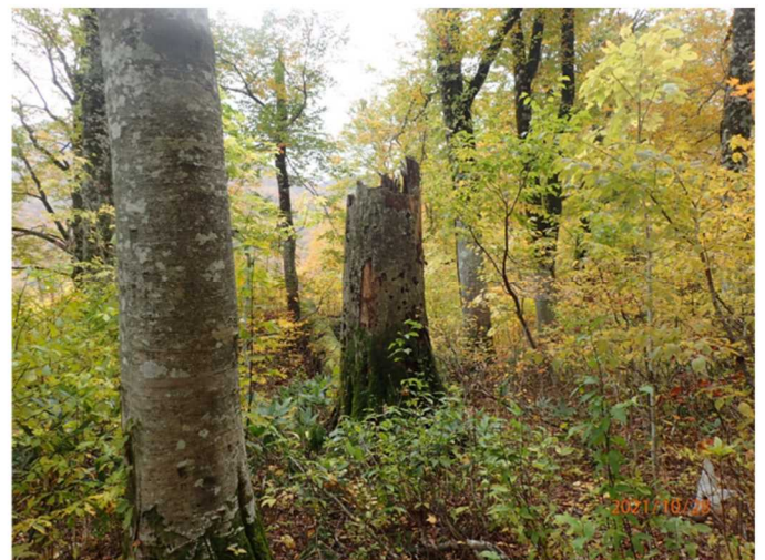
写真1 金目川サイトの森林内の様子

（左）矢印で示した樹木がブナです。（右）中央の幹の折れたブナは 5 年前の調査時は生きていました。