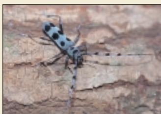
ルリボシカミキリ