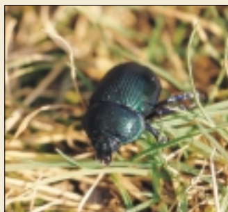
オオセンチコガネ