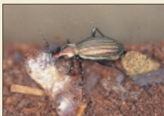
オオルリオサムシ