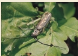
シロスジカミキリ