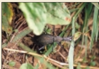
ヒメマイマイカブリ