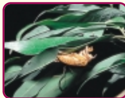
ヒグラシのぬけがら