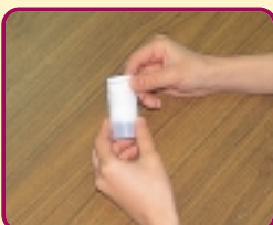
丸めてフィルムケースに入れる