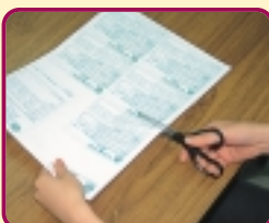
調査票を切って、必要事項を記入する