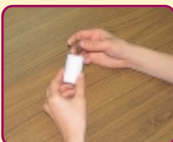
セミのぬけがらを1個入れる