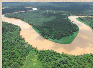
ボルネオ最大のキナバタンガン川の対岸は川沿いにまで農園が拡大している。

円卓会議）にも入会しました。 Q サバ州政府に働きかけ、2007年には熱帯雨林と生物多様性を保全するための非営利団体「ボルネオ保全トラスト」を設立されましたね。 A ボルネオ島に残る熱帯雨林を保護区にする活動です。野生動物の生息域が分断されていけば、結局彼らの数は減ってしまいます。生息地をつなぐ「緑の回廊」が重要と考えて、そのための土地の購入を売り上げから支援しています。最近では、活動が農園主にも理解されるようになり、生物多様性のガイドラインをつくるころまで意識が変わってきました。 Q 一般の家庭用石けん、洗剤をすべてRSPO認証のパーム油100%の使用を実現され、それに続いて大手洗剤メーカー