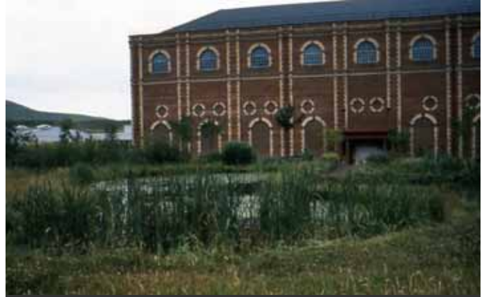
工場敷地内で環境教育に活用されているビオトープ（英国）