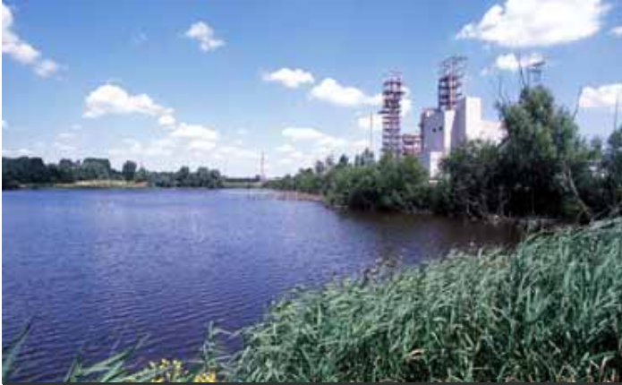
鳥や魚など多様な種が生息するプラントの緑地（ベルギー）