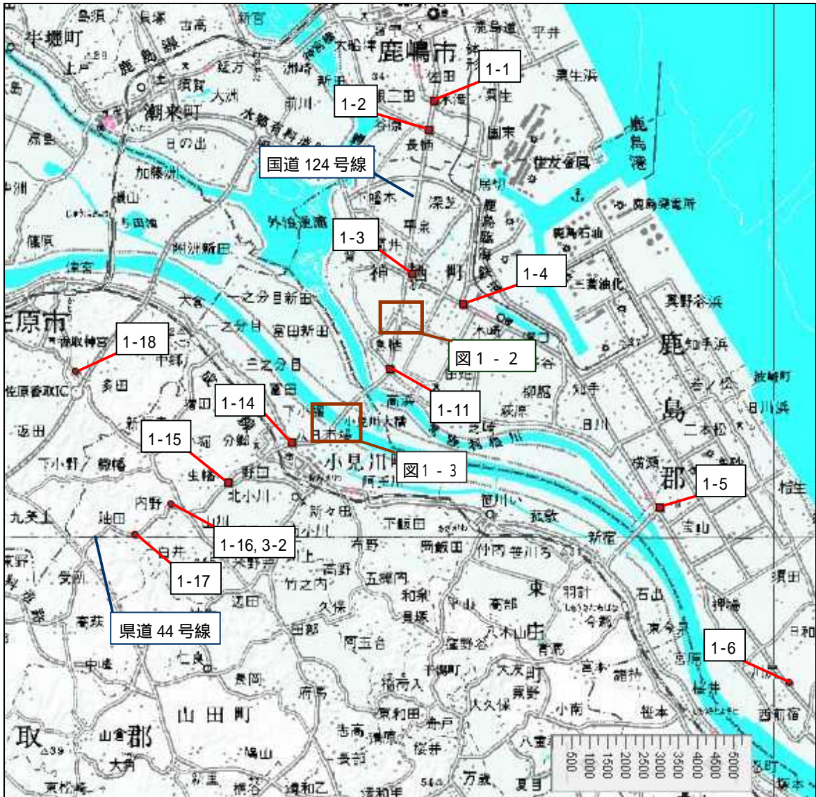
図1-1 鹿島港周辺図(1/20万図 千葉)