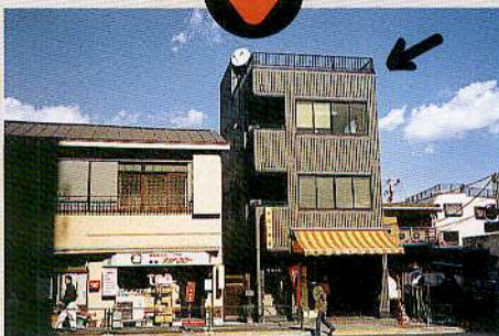
他の建物が写ってしまう場合には、写真のなかに矢印をつけることで、どの建物か分かります(写真左)