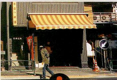
近すぎて何階建てが分かりません(写真左)

建物全体のようなすがつめるのが良い写真です。遠くから写しすぎると、どの建造物なのかがよく分かりません。またアップにしすぎると、何階建てかなどが分からなくなってしまいます。かならず地面から建造物のでっぺんまでを入れた写真にしてください。写真の必要な部分を切り取って貼ってもかまいません。どうしても他の建物などが写ってしまう場合には、写真のなかにマジックで矢印をつけて、どの建物なのかが分かるようにしてください。なお、写真をタテに写した場合には、同じようにヨコにして貼ってください。