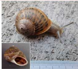
ヒメリンゴマイマイ (2015.5.2 神栖市波崎) 殻径3~4cm。殻は赤褐色で黒い縞模様があり、全体的に丸い形をしている。

著者らは2015年4月下旬、茨城県神栖市波崎にある民家の庭の花壇に本種と思われる陸貝が発生しているとの情報を得たため、5月2日に現地サンプルの採集と生息調査を実施した。その結果、発生種はヒメリンゴマイマイで、生息地が複数存在し、園芸植物が被害されていることが分かった。現在、本種の生息状況や分布の詳細を把握するため、国と県が協力して調査を行っている。これまでに6月16日、7月29日、8月22日に、神栖市と鉾子市の墓地や民家の花壇などで現地調査を行った。