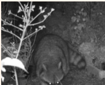
赤外線カメラによるアライグマの確認