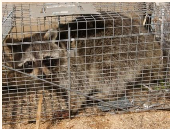
捕獲したアライグマのオス(2013年4月)