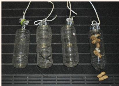
餌トラップの状況