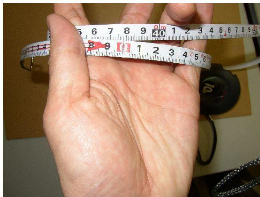
図8 スチールメジャーの読み取り方. 上の写真の場合、37.8cmと読む。