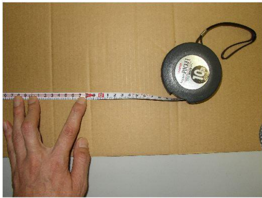
図4 スチールメジャー