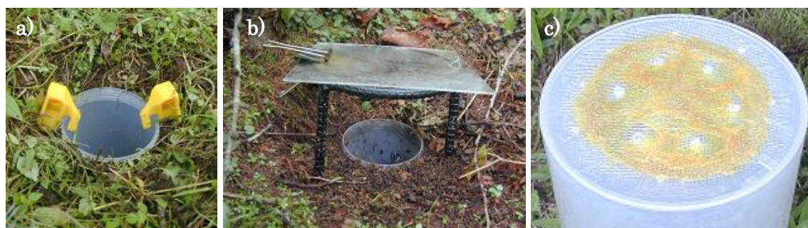
図 3. トラップの設置・加工例. a) ペグを用いたトラップの固定. b) 雨よけの設置例. c) 底面の加工例. 大きい水抜き穴を 6ヶ所開け、穴を覆うように目開き 1mm の網を接着している.

小型の甲虫が出入りできないよう、水抜き穴を覆うように目開き 1 mm 以下の網を貼り付ける。サイトでの加工が困難な場合は、ネットワークセンターに相談する。