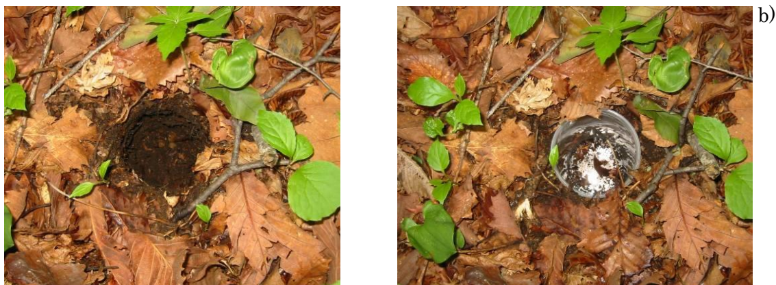
図 2. トラップ容器の埋設方法. a) トラップ容器を埋設するための穴. b) トラップ容器を埋設した林床の状態.

※大型動物にトラップを抜き取られる被害が出やすい場合は、ペグ等を用いてトラップを固定する（図 3a）。