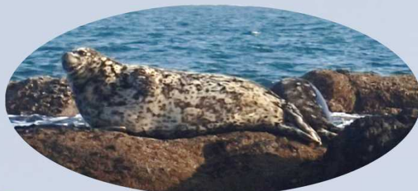
ゼニガタアザラシ（標本初公開）