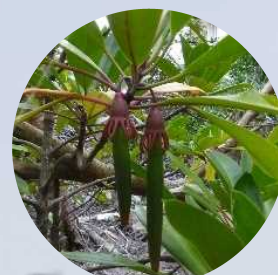
オヒルギ（マングローブの一種）