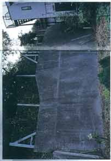
急傾斜地崩壊危険箇所で造られたコンクリートの擁壁

戦 後最悪の災害を記録した阪神淡路大震災(マグニチュード7.2)をほうふつさせるように、昨年(1999年)、台湾でマグニチュード7.6の直下型大地震が起こりました。この地震では、山地と平野の地形境界に沿ってはしる地震断層が、50kmにわたって地表に現れ、石岡ダム(堤高25m、堤長357m)や長庚橋など、断層直上の多くの大規模建築物が、最大10mの垂直方向の断層変異により、崩壊しま