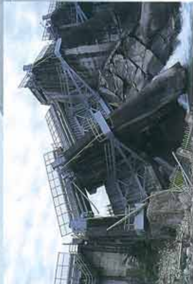
石岡ダム(台湾)。ダムの直下に断層があることは、今日の地震ではじめて分かったといわれています。