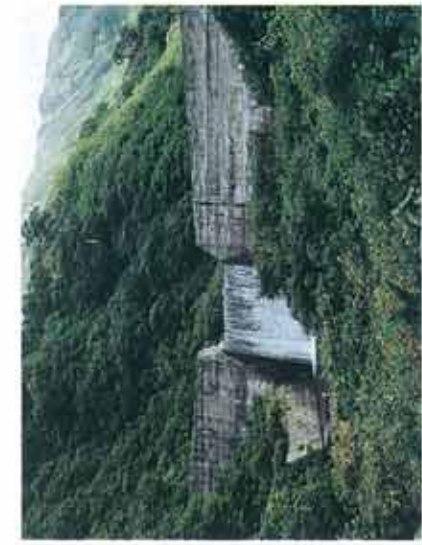
土石流を抑えるために取り付けられた砂防ダム

した。斜面を造成してつくった立派な住宅地も崩壊しました。以前湿地だった場所など軟弱地盤上の建物は、断層から離れた場所でも被害が見られました。「日本の活断層」(活断層研究会)によれば、日本には活動度の高いA級活断層が100本、それに次ぐB級活断層が760本、C級活断層が450本あるとなっていますが、まだ見つからない活断層も多くあると考えられています。また、存在が既に知られ