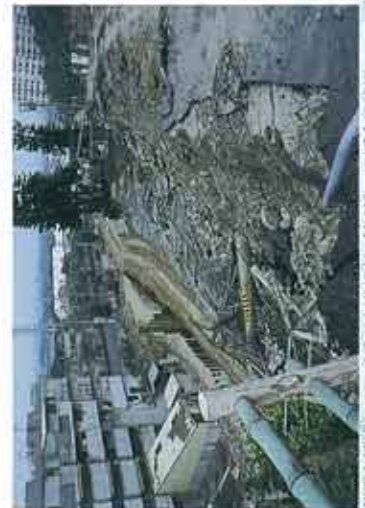
斜面を造成してつくられた住宅地(台湾)、ほぼ全壊状態。台湾大地震では2,300余名の人が犠牲になりました。

防災施設を盛りつけてきましたが、土砂災害の危険箇所数は減るところか増えています。防火のありかたを、根本から見直す時に来ています。