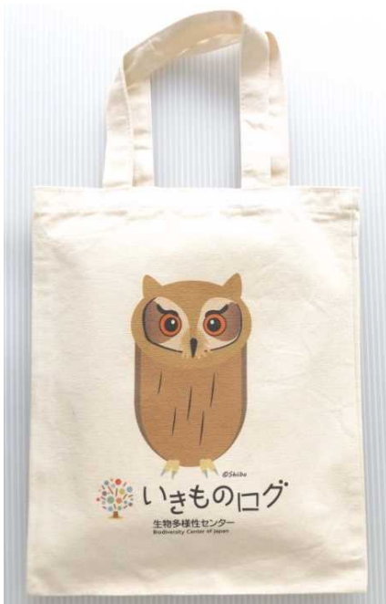
オリジナルエコバッグ (A4サイズのクリアファイルが ちょうど入ります)