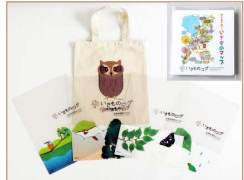
『いきものログオリジナルグッズ』