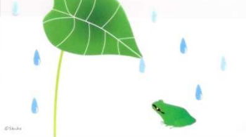
オリジナルクリアファイル (A4 サイズ) (カワセミ・ムササビ・オオムラサキ・アマガエルの4種類)