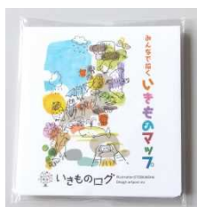
オリジナルふせん (イメージ)