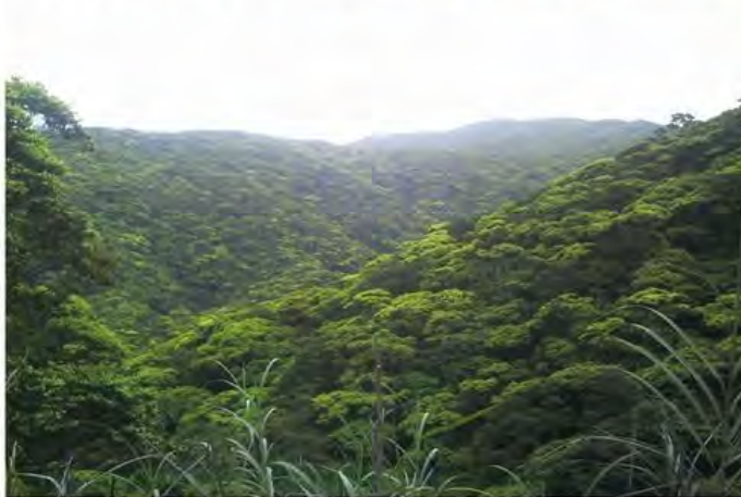
亜熱帯照葉樹林の外観(奄美大島)