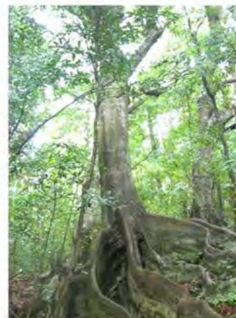
常緑広葉樹のオキナワラジロガシ(徳之島)