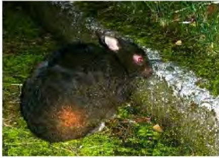
アマミノクロウサギ