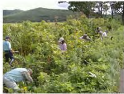
外来植物の駆除作業