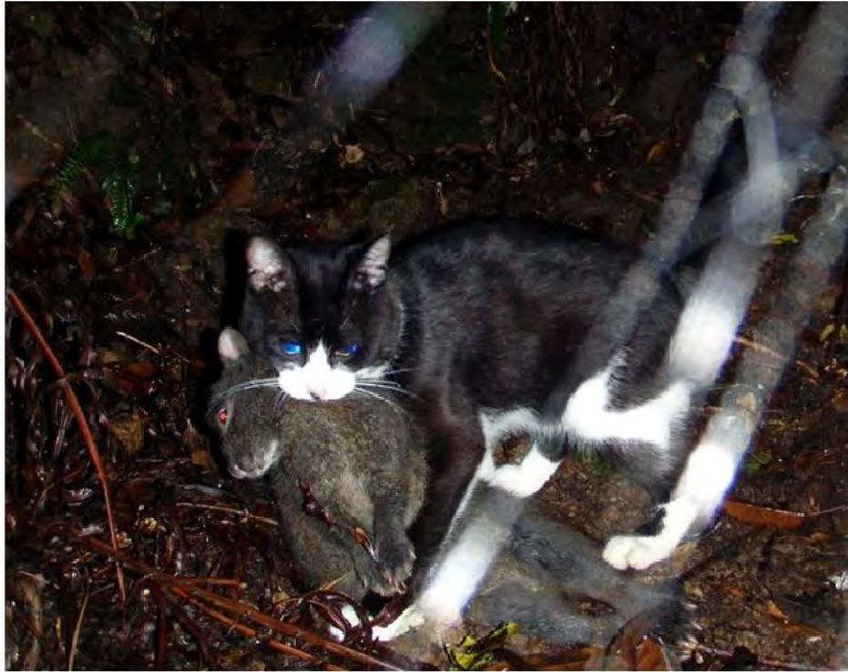
アマミノクロウサギを食べるノネコ