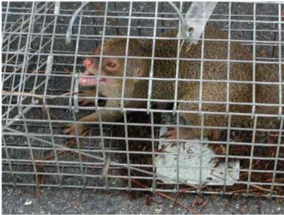
捕獲されたマングース