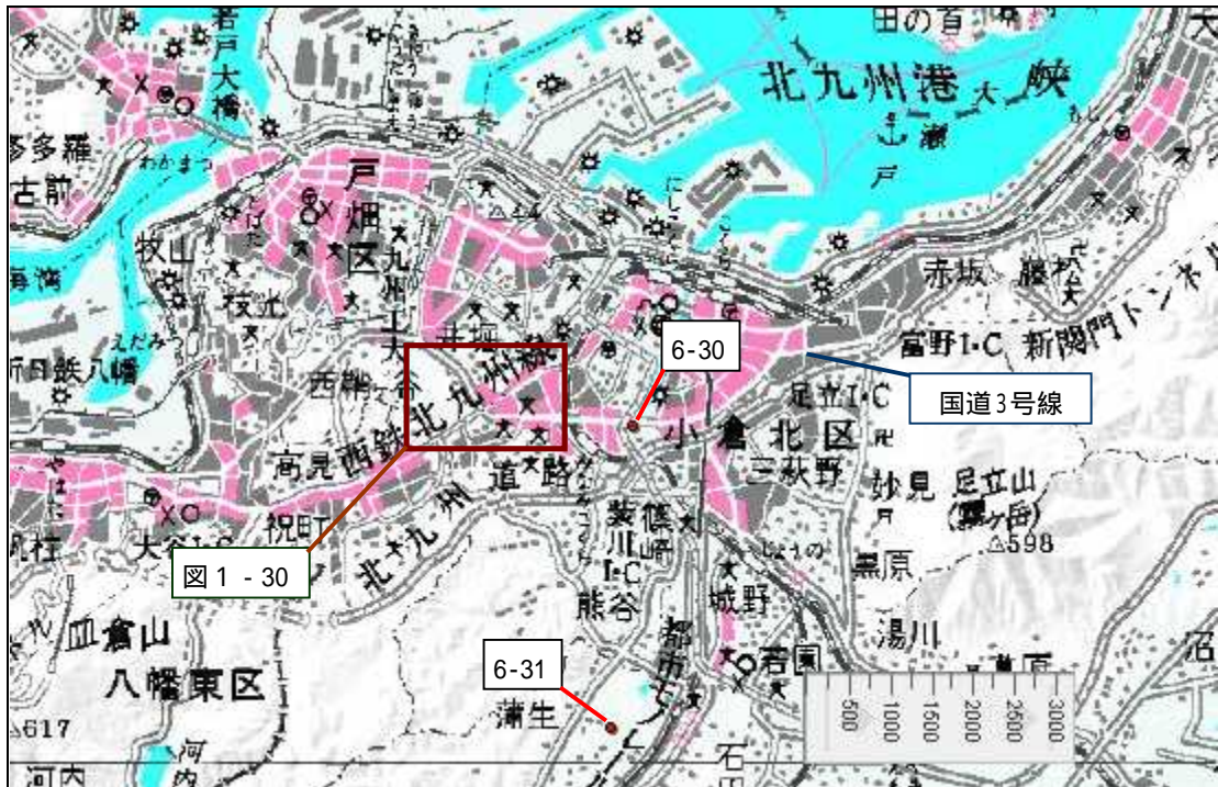
図 1 - 29 北九州港周辺 ( 1 / 20 万図 福岡 )