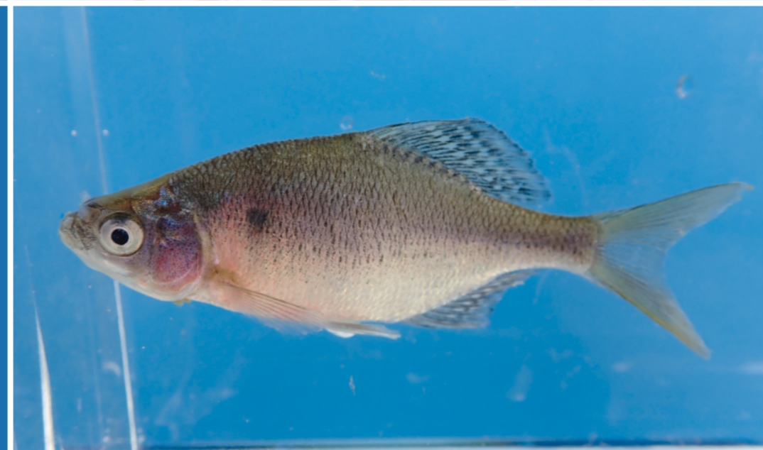
ゼニタナゴ（2020年11月6日 撮影） 絶滅危惧IA類。2015年の調査に引き続き確認することができました。