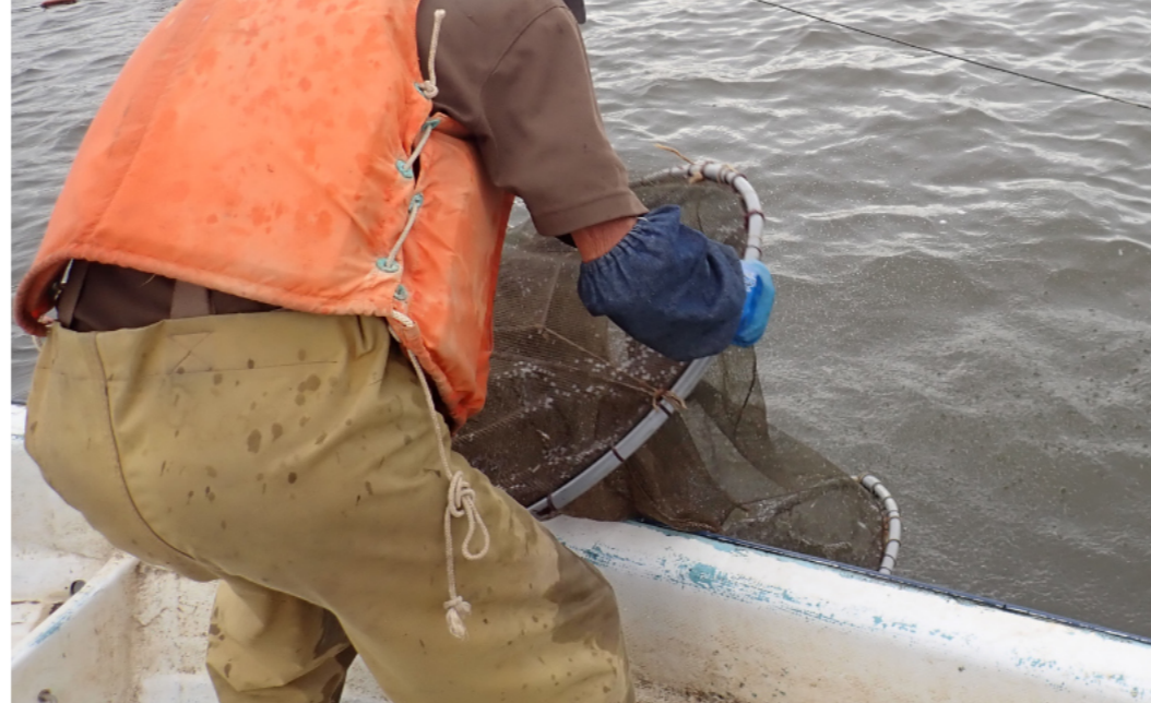
定置網を引き上げる様子（2020年7月10日 撮影） どんな魚が入っているか楽しみな瞬間です。