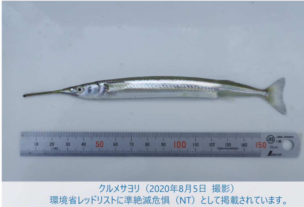
クルマサヨリ（2020年8月5日 撮影）