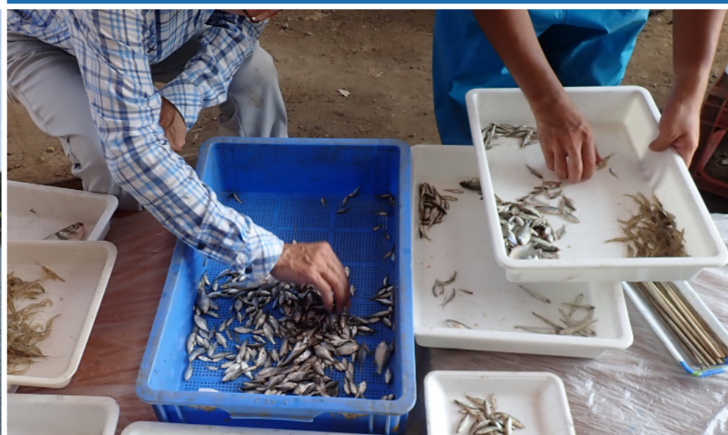
定置網で採集された魚の仕分け作業（2020年8月19日 撮影） ざっと形などで分けて、その後、種類ごとに細かく分けていきます。