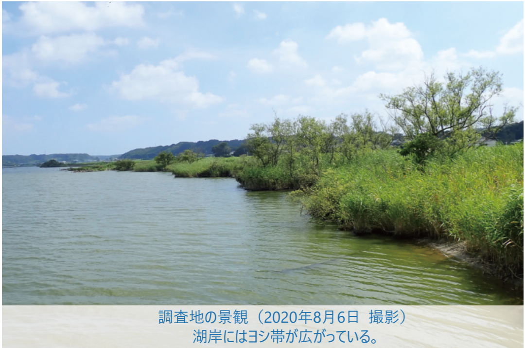
調査地の景観（2020年8月6日 撮影） 湖岸にはヨシ帯が広がっている。