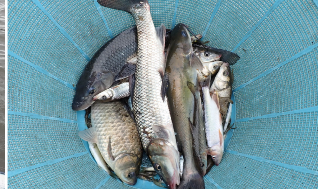
1回目の採集物の一部（2020年7月10日 撮影） 写真にはニゴイ、ギンブナ、スズキ、チャンネルキャットフィッシュなどが写っています。