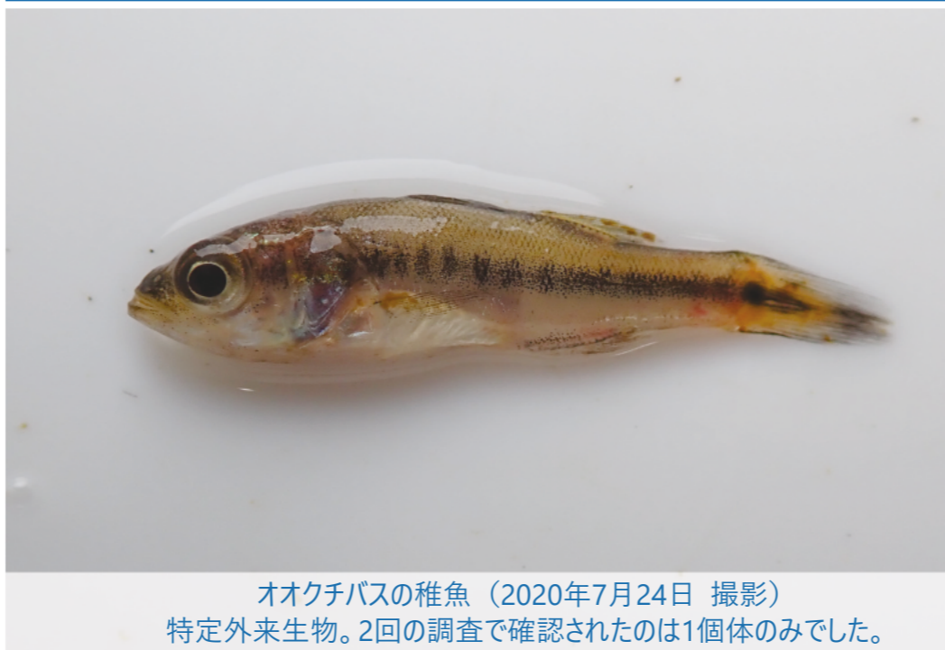
オオクチバスの稚魚（2020年7月24日 撮影） 特定外来生物。2回の調査で確認されたのは1個体のみでした。