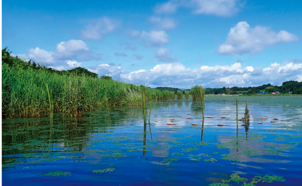
調査地の景観（2020年7月24日 撮影） 湖辺にはヨシ帯が広がり、湖面にはオニビシの群落が見られます。