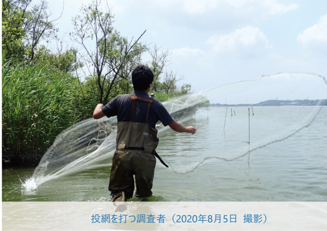
投網を打つ調査者（2020年8月5日 撮影）