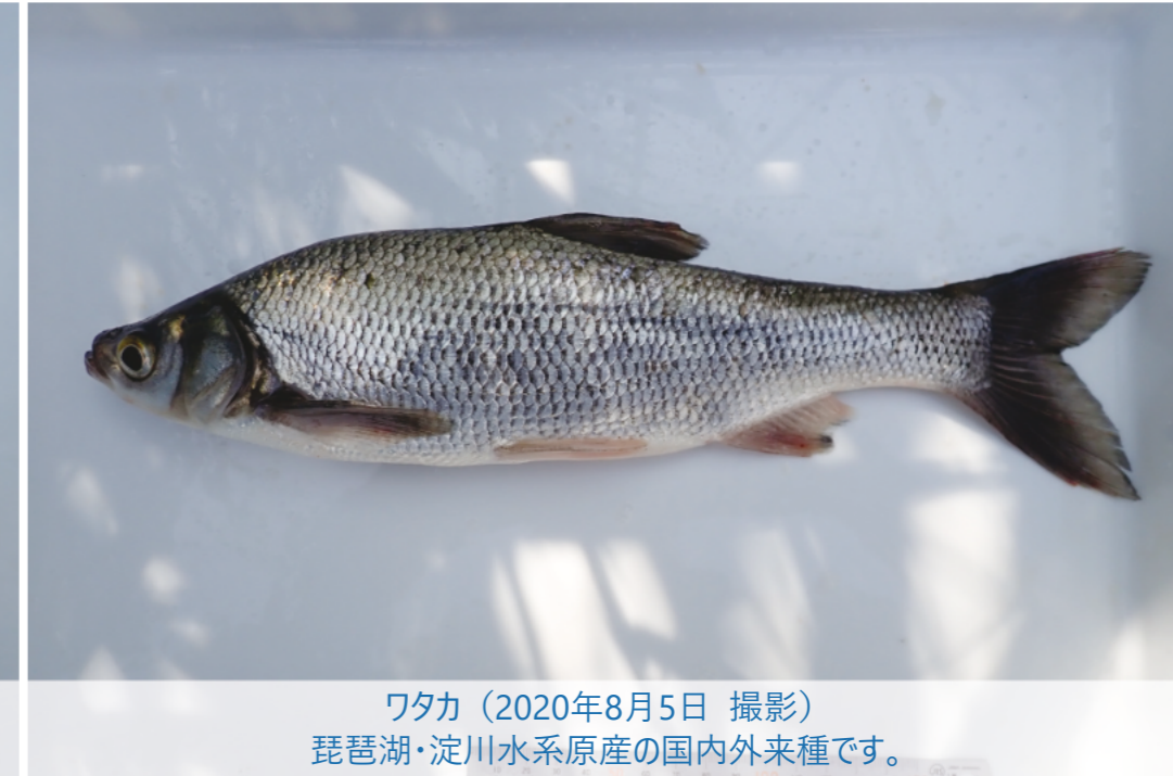
ワタカ（2020年8月5日 撮影）