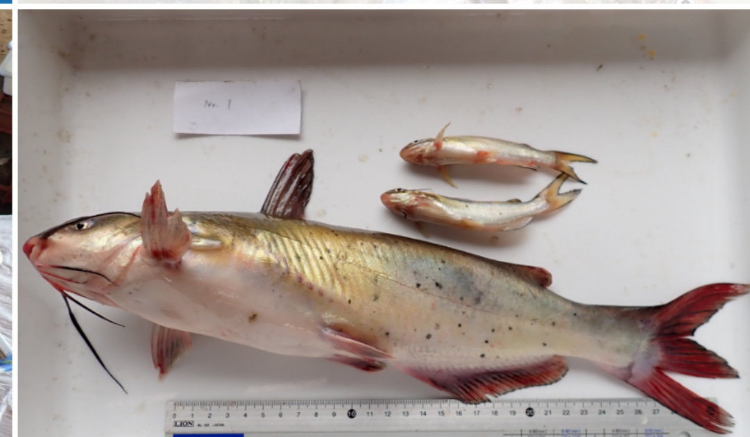
1回目の調査でも、2回目の調査でも、数多く採集された特定外来生物のチャンネルキャットフィッシュ（2020年7月10日 撮影）。