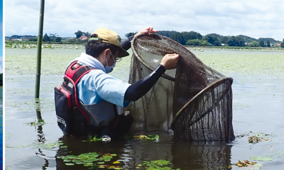
定置網を回収する調査者（2020年7月24日 撮影）