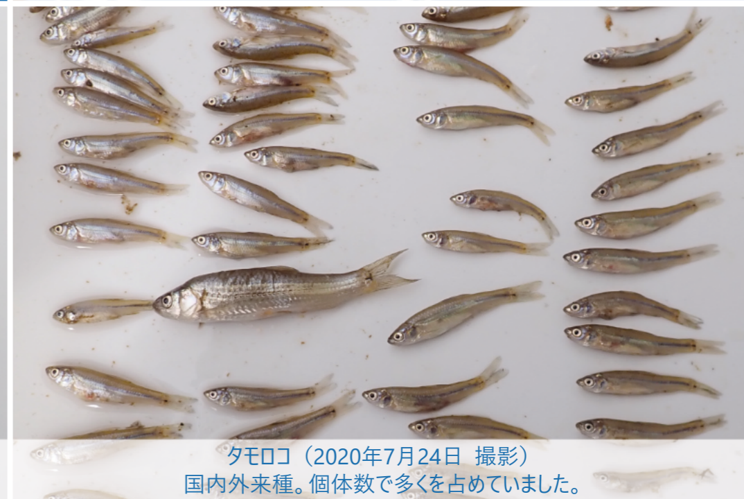
タモロコ（2020年7月24日 撮影） 国内外来種。個体数で多くを占めていました。