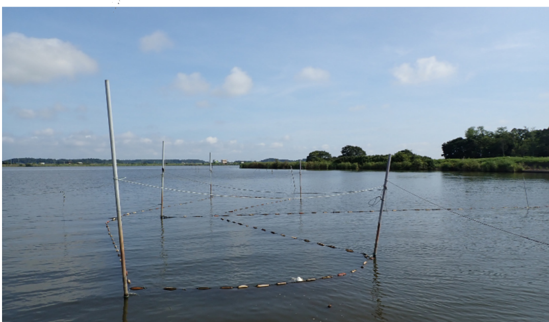
調査地の様子（2020年8月19日 撮影） 船上から沿岸に設置した大型の定置網を望む。