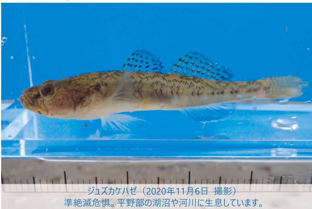
ジュズカケハゼ（2020年11月6日 撮影） 準絶滅危惧。平野部の湖沼や河川に生息しています。